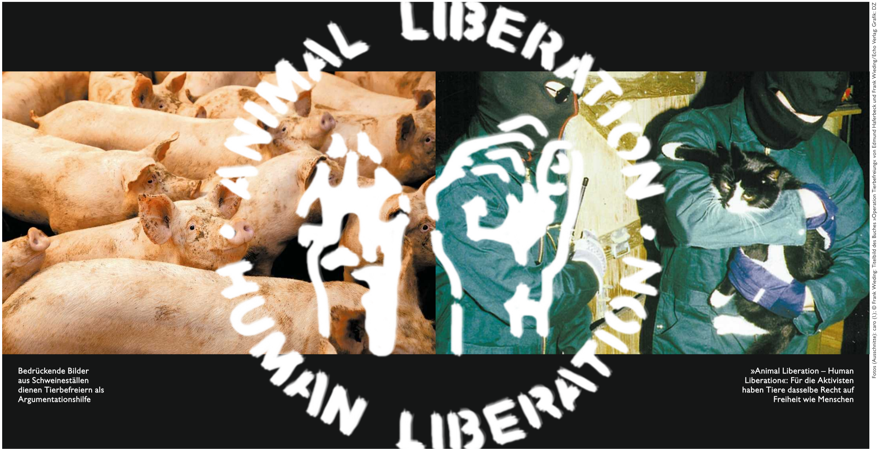
Bedrückende Bilder aus Schweineställen dienen Tierbefreibern als Argumentationshilfe