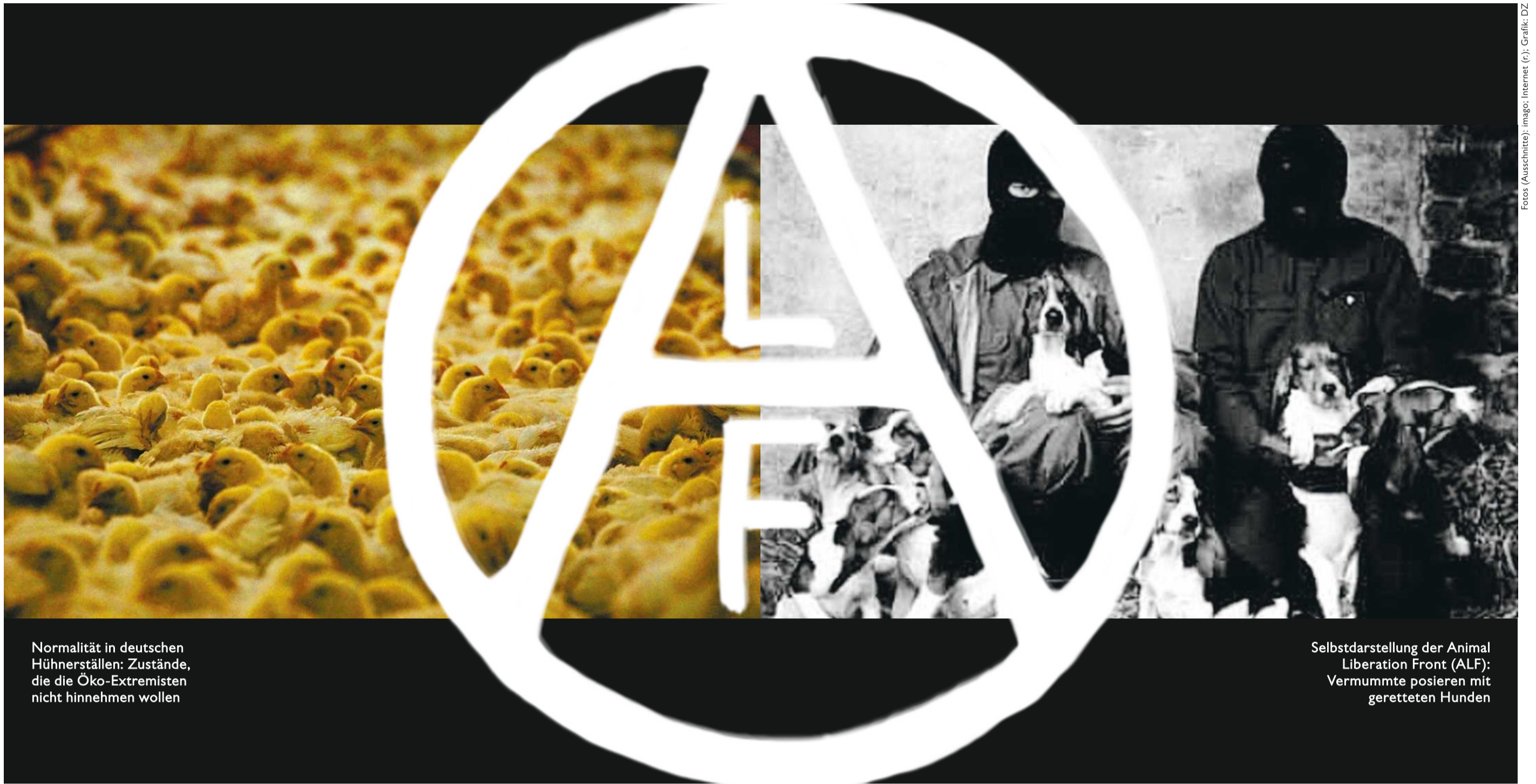
Normalität in deutschen Hühnerställen: Zustände, die die Öko-Extremisten nicht hinnehmen wollen